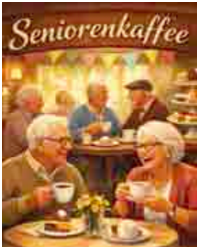
letzter Donnerstag im Monat von 14:30 bis 17 Uhr