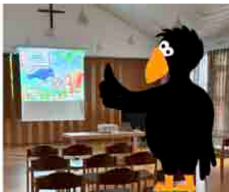
Bilderbuchkino im Café Rabe

IHR EXPERTE IN ALLEN VERSICHERUNGS- UND FINANZFRAGEN.