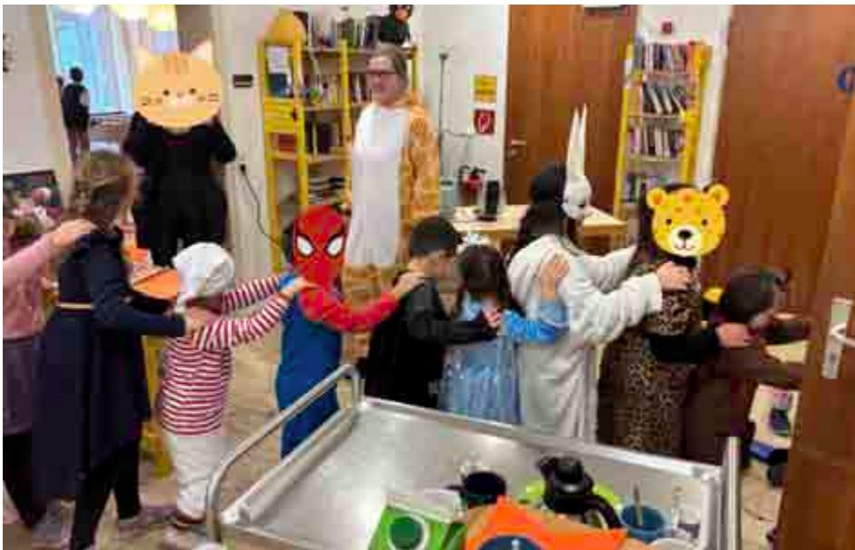
Polonaise bei unserer Faschingspartyveranstalter

ziale, feinfühliges Wesen und vor allem fürsorgliche Eltern. Genau diesen Gedanken greift das Angebot auf: Eltern können hier in entspannter Atmosphäre miteinander ins Gespräch kommen, sich ausruhen und neue Impulse für ihren Familienalltag erhalten – abgestimmt auf die Bedürfnisse der Eltern vor Ort. Das Café Rabe stärkt das Miteinander im Stadtteil auf herzliche und lebendige Weise. Es ist eine Initiative der Erlösergemeinde Albersbösch und des Stadtteil- und Familienzentrums Albersbösch und wird durch das Programm STÄRKE finanziert.