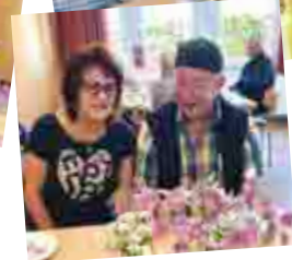
Hausmeister und Blumenfee